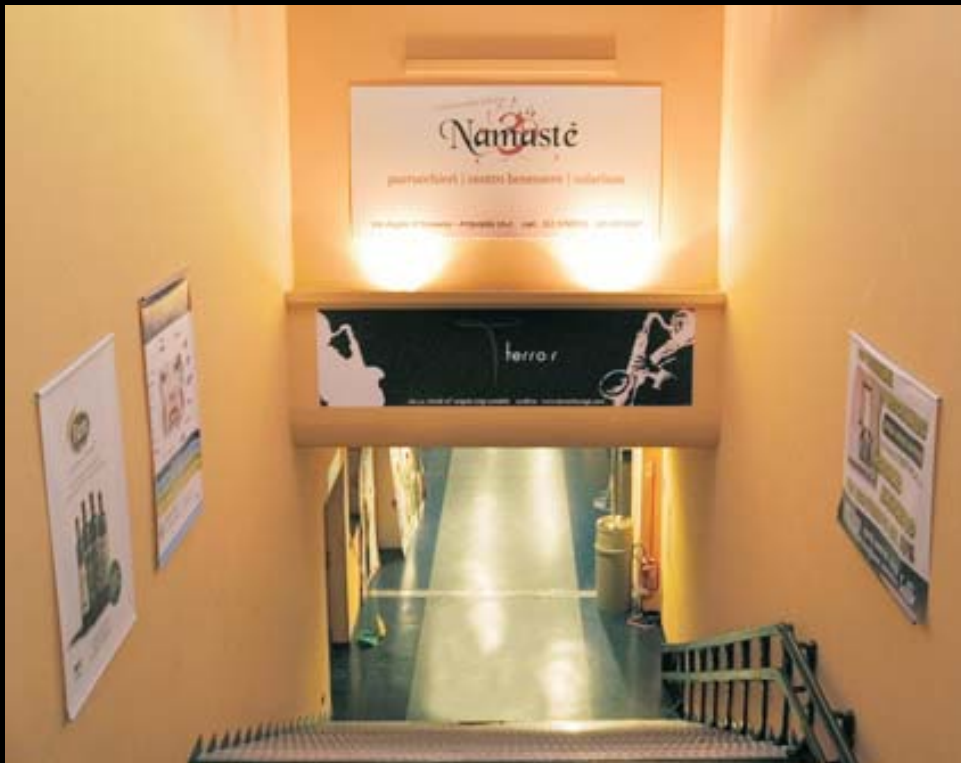
PANNELLI E BANNER SCALE